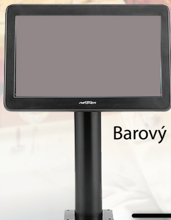
Barový LCD displej

• efektivní vyřízení objednávky jídel a nápojů