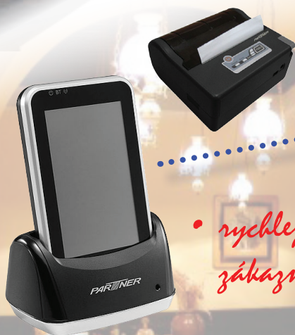
PDA OT-200, mobilní termotiskárna MP300