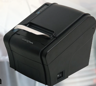
Tisk objednávky jídla v kuchyni